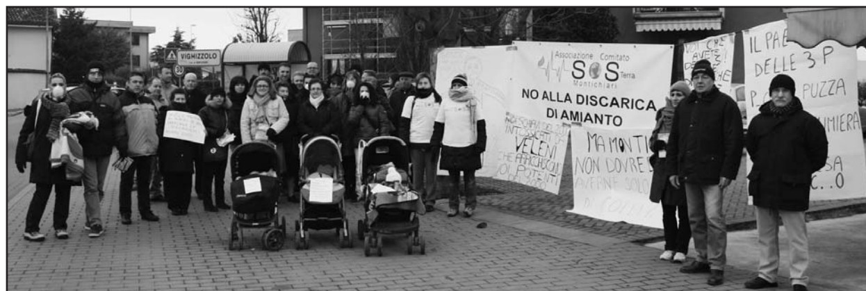
La manifestazione presso l'entrata di Vighizzolo con la distribuzione di volantini informativi.