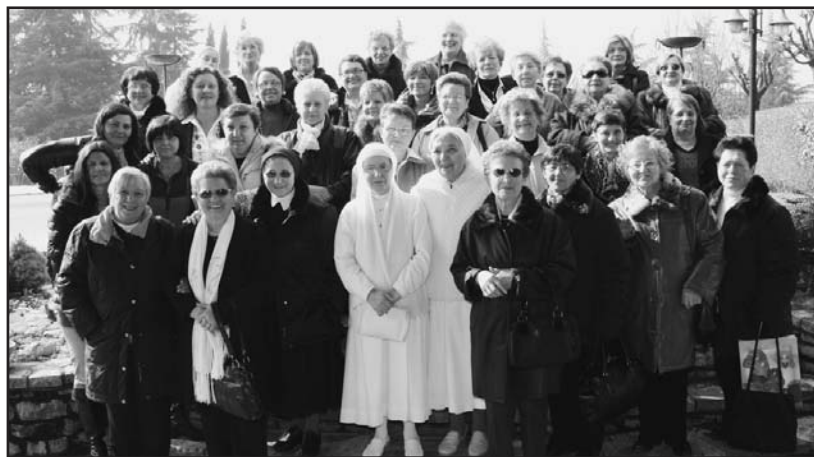
14 marzo 2010, l'ultimo incontro delle "ex orfanelle".