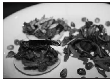
Il piatto consumato dai commensali.

All'inizio della serata il responsabile dell'iniziativa ha tenuto una lezione sull'importanza delle qualità organolettiche, dalle cavallette ai lombrichi, ed agli altri insetti cucinati con