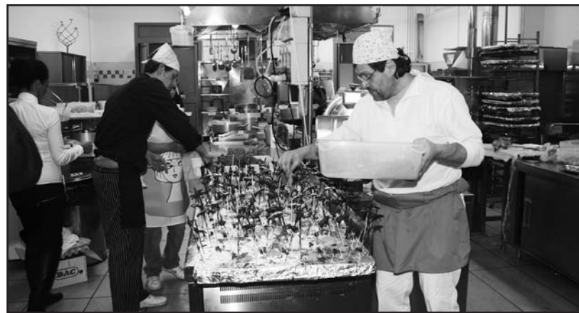
L'accurata preparazione del menù.