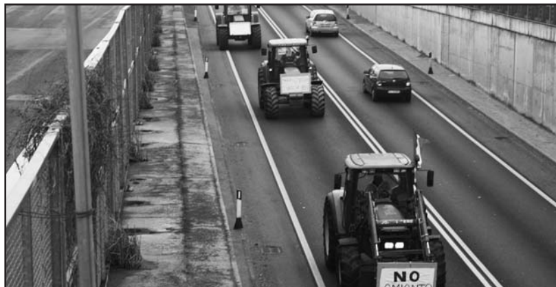
La colonna dei trattori.

In località Maringoncello numerosi vighizzolesi hanno predisposto cartelli contro la discarica ed i suoi effetti collaterali, precisando che nelle carrozelle vi erano dei bambolotti. L'effetto più significativo si è registrato nella via Martiri della Libertà, essendoci anche il tradizionale mercato delle bancarelle. I trattori, a passo d'uomo, hanno percorso le vie del paese cercando di creare curiosità a sostegno dell'iniziativa. Una battaglia contro la discarica Ecoeternit che dura da circa un