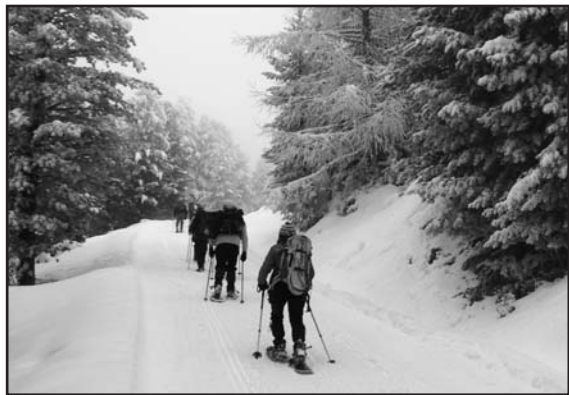
Un paesaggio suggestivo.

I prossimi mesi di febbraio e marzo sono programmati per escursioni al monte Gardena con partenza da Schilpario, al rifugio Lancia nel gruppo del Pasubio, al bivacco Occhi da Veza d'Oglio, in Val Canè fra Edolo e Ponte di Legno: tutte gite da effettuarsi con l'uso delle ciaspole. Nella speranza che il tempo favorisca le nostre camminate ed i partecipanti siano numerosi, soddisfatti e desiderosi di trasmettere ad altri l'entusiasmo che ci anima, ricordiamo che il gruppo è aperto a tutti e che la nostra gioia e la nostra amicizia la condividiamo volentieri anche con te, quindi vieni anche tu a vedere il mondo da un altro punto di vista!